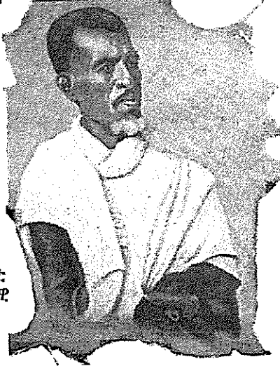
ናብ ገፅ 33 ይዘውር

አይተ ስዮ፡፡ እነ በቲ ናትና ትውልዲ ዘጋጠሞ ፊተና (challenge) ንዑኡ ንምፍታሕ ዝተኸተሎ እካይዳ ኔሩ፡፡ እቲ ናትና ትውልዲ ሓያል ትውልዲ ኔሩ፡፡ እምቢተኛ ትውልዲ ነይሩ፡፡ ሰብ ጠበንጃ ስልጣን ሓዞም አይትታክቡ አይትሰለፉ አይትማኸሩ አይትዕላፉ እንትብሉና እንተለዉ ዋይ ይአኸሰናሉ ኢልና ጠበንጃ ሓዝና በረካ ሽይድና ተቐላሰናም ኢና፡፡ ዝተኸተልናይ መገዲ ሽዑ ንሞት ንመስዋእትነት ንሽግር ንመከራ አፍልብኻ ሂ ብ ካ